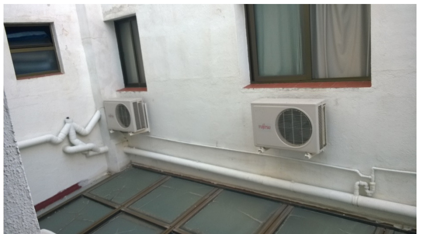
Hotelli Las Rampasin aula ja näkymät minun huoneeni ikkunasta.